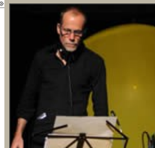
Ma 27/05 in Logos, Gent