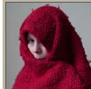
Zo 2/06 in het Concertgebouw, Brugge