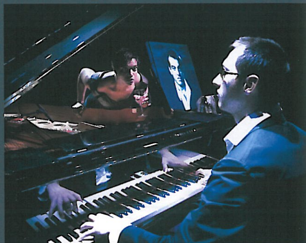
LILITH